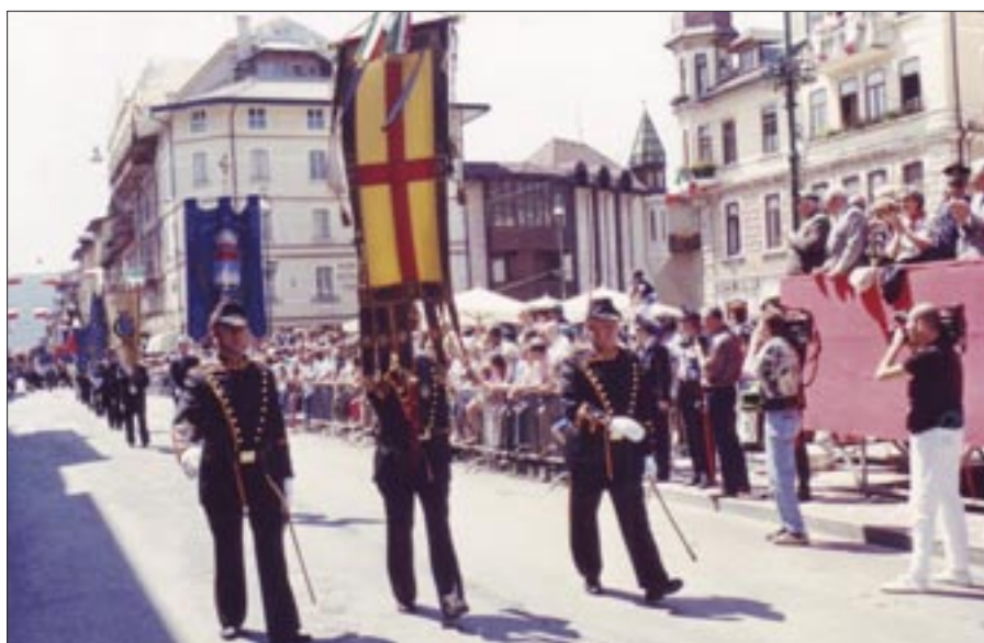
8 - 9 giugno 1996. Asiago. 26° Raduno nazionale dell'Associazione Nazionale Granatieri di Sardegna in occasione dell'80° anniversario della battaglia di Monte Cengio. Sfilano i Gonfaloni delle città di Vicenza, di Asiago e dei Comuni limitrofi alla cittadina

Il 1996 fu un anno "frizzantino". Il 26° raduno nazionale ad Asiago (8 - 9 giugno), il trasferimento di sede del 2° reggimento da Roma a Spoleto (30 giugno), la consegna della Bandiera di combattimento a "Nave Granatiere" a La Spezia (6 luglio), oltre gli annuali raduni, resero intensa la vita associativa. Il 6