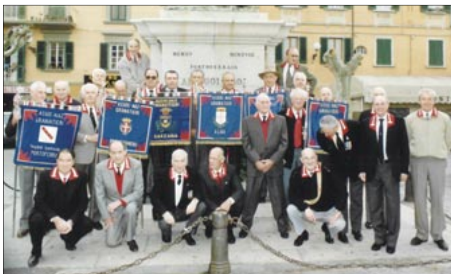
30 aprile 1992. Portoferraio. I reduci del battaglione “S” del raggruppamento speciale Granatieri ai piedi del Monumento ai Caduti