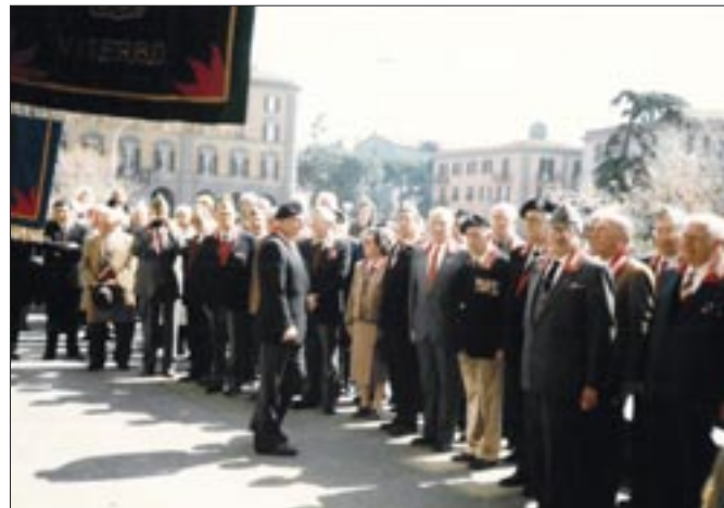
13 aprile 1991. Viterbo. I reduci della compagnia volontari universitari del 3° Granatieri schierati di fronte alla lapide commemorativa sulle mura della Caserma "La Rocca"

Le drammatiche vicende seguite all'occupazione irakena del Kuwait sul finire del 1990 misero in forse lo svolgimento di alcune attività associative come la stesura e la pubblicazione del quarto numero annuale de "IL GRANATIERE".