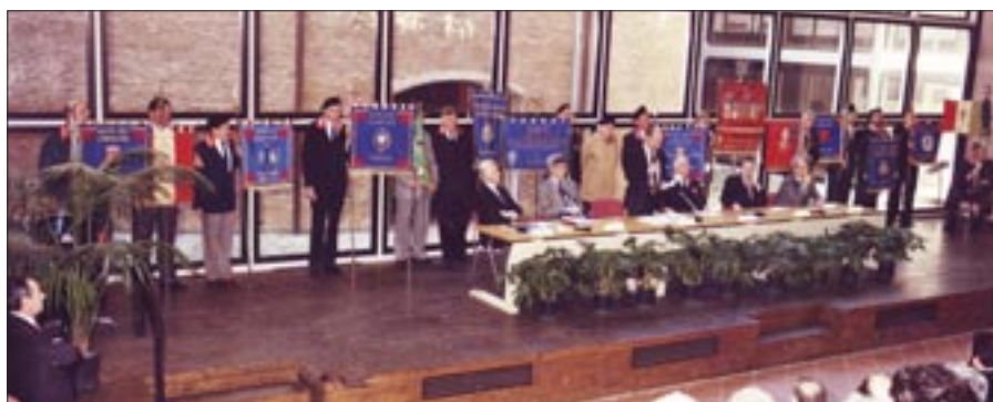
10 marzo 1995. Bologna. Aula Magna dell’Università. Cerimonia di consegna di laurea “honoris causa” al Granatiere Sottotenente Medaglia d’Oro al Valor Militare Antonio Yukasina. Visione d’insieme dell’aula

Le iniziative furono numerose e tra queste le principali furono: 19 marzo, Cortellazzo (VE), raduno regionale organizzato dal Centro