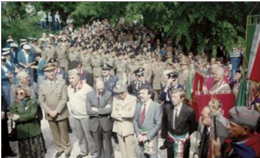
Monte Cengio 10 giugno 1990. Annuale pellegrinaggio in memoria della battaglia del maggio – giugno 1916

Presidente nazionale fu il Gen. D. Roberto Di Nardo, già 81° Comandante del 1° reggimento “Granatieri di Sardegna”.