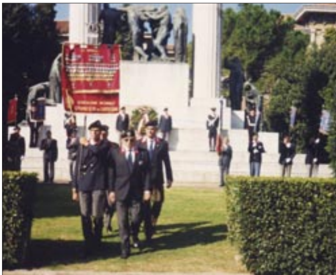
4 - 6 ottobre 1991. Treviso. 24° Raduno nazionale, il Medagliere nazionale lascia il Monumento ai Caduti di Treviso al termine della cerimonia di deposizione di una corona d'alloro