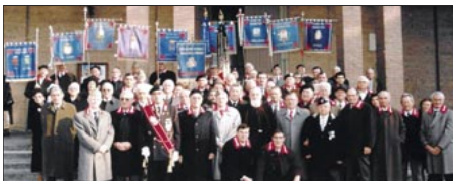
3 dicembre 1995. Rovigo. I Granatieri partecipanti al Raduno del Centro regionale Veneto attorniano Padre Chiti