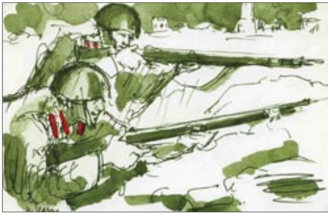
10 - 12 settembre 1993. Roma. 25° Raduno nazionale dell'Associazione Nazionale Granatieri di Sardegna in occasione del 50° anniversario della difesa di Roma. Cartolina commemorativa con disegno del Gra. Maestro Umberto Sgarzi reduce dei combattimenti