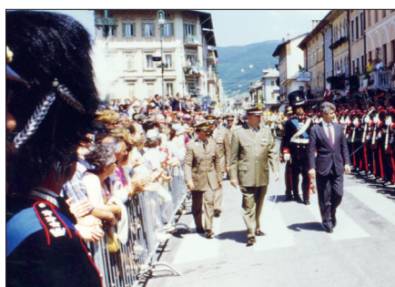
STORIA DELL'ASSOCIAZIONE GRANATIERI DI SARDEGNA