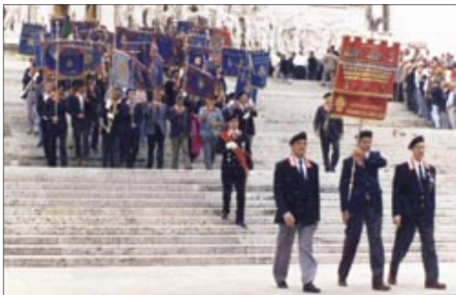
10 - 12 settembre 1993. Roma. 25° Raduno nazionale dell'Associazione Nazionale Granatieri di Sardegna in occasione del 50° anniversario della difesa di Roma. Il Medagliere nazionale e le Bandiere Colonnelle scendono dalla scalinata dell'Altare della Patria dopo la deposizione di una corona di alloro al Sacello del Milite Ignoto