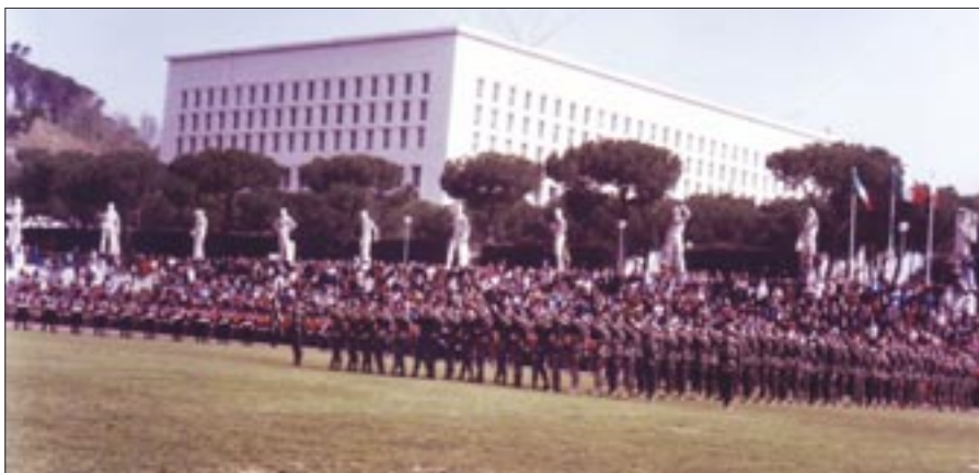
11 aprile 1992. Roma. Stadio dei Marmi. 333° anniversario della costituzione del Corpo. Giuramento solenne delle reclute del 2° scaglione 1992. Giornata del Decorato di Medaglia d'Oro al Valor Militare. Saggio di addestramento formale

Il 1992 fu un anno in cui, oltre al raduno annuale dei reduci del IV battaglione controcarri, ai raduni sul "Cengio" (14 giugno) ed a Flambrò (25 ottobre), a quelli a livello interregionale a San Miniato – Ponte di Egola, con l'inaugurazione del Monumento alla Medaglia d'Oro al Valor Militare Stellato Spalletti (8 novembre) ed a livello regionale: Marche, San Severino Marche (26 aprile); Veneto, Buia (31 maggio) e Tamai di Brugnera (6 settembre), gli eventi di particolare rilievo furono la festa del Corpo celebrata allo Stadio dei Marmi a Roma (11 aprile) ed il raduno dei reduci dell'Africa a Viterbo (4 ottobre) e, come già indicato in premessa, alla presenza del Medagliere nazionale, il ritorno in vita dei tre reggimenti il 29 settembre il 1°, il 19 ottobre il 2° ed il 21 successivo il 3°.