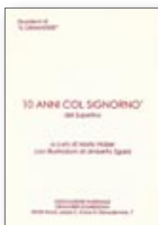
LIBRO "10 ANNI COL SIGNORNÒ" € 8,00