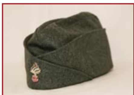
BUSTINA GRIGIOVERDE € 10,00