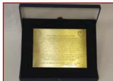
TARGA IN OTTONE «GIACCONE» CON ASTUCCIO € 18,00

Ai costi dei singoli articoli vanno aggiunte le spese dell'eventuale spedizione. Il prezzo di vendita degli articoli viene aggiornato in relazione ai nuovi costi di acquisto del materiale.