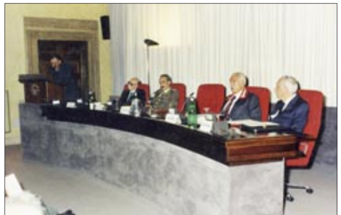
10 - 12 settembre 1993. Roma. 25° Raduno nazionale dell'Associazione Nazionale Granatieri di Sardegna in occasione del 50° anniversario della difesa di Roma. Centro Alti Studi Militari. 9 settembre 1993. Presentazione del libro "La Difesa di Roma ed i Granatieri di Sardegna nel settembre 1943", edito dal Centro Studi dell'ANGS

interprete verso tutti i partecipanti al raduno dei miei sentimenti di ammirazione e di profonda gratitudine per tanta ricchezza di servizio ai valori più alti e più veri della Patria, e del mio augurio che questo grande esempio di dovere compiuto sempre con fedeltà e onore, diventi impegno e vita per i nostri giovani. Sono con voi! Con cordiale animo. Oscar Luigi Scalfaro " Il messaggio del Capo dello Stato rivolto al Presidente nazionale dell'Associazione fu l'inizio del 25° raduno nazionale.