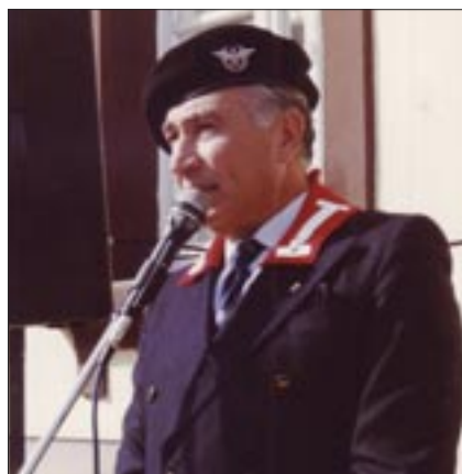
Gen. D. Roberto Di Nardo, Presidente nazionale dal 27 aprile 1990 al 26 novembre 2002

Il ritorno ordinativo dei tre reggimenti costituì l'evento più significativo del periodo, anche se vennero organizzati cinque raduni nazionali: Treviso (1991), Roma (1993) in occasione del cinquantesimo anniversario della difesa di Roma, Asiago (1996) per l'80° anniversario della battaglia del Cengio, Spoleto (1999) e Cuneo (2002).