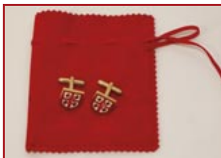
GEMELLI CON SCUDETTO QUATTRO MORI € 16,00