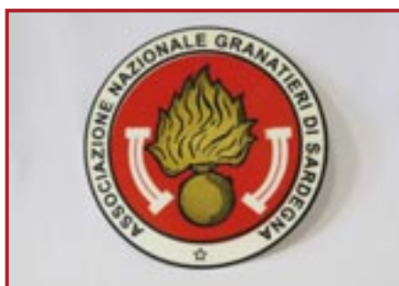
DISCO AUTOADESIVO PER MACCHINA € 1,00