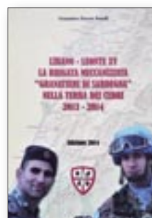
LIBRO "LIBANO - LEONTE XV LA BRIGATA MECCANIZZATA "GRANATIERI DI SARDEGNA" NELLA TERRA DEI CEDRI, 2013-2014" € 5,00