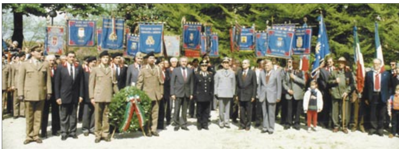
2 maggio 1993. Alba (CN). Raduno del Centro Regionale "Piemonte"