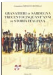
LIBRO "GRANATIERI DI SARDEGNA 350 ANNI DI STORIA ITALIANA" € 20,00