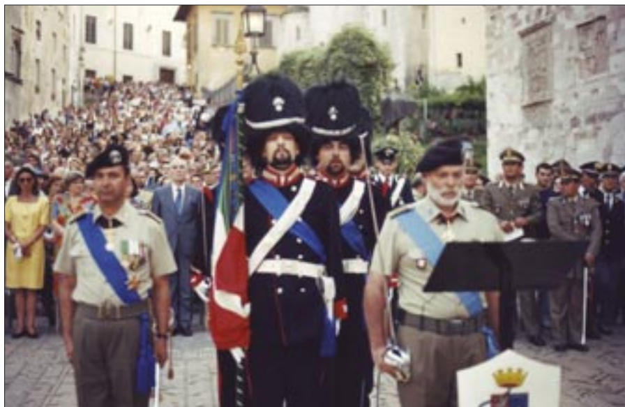
30 giugno 1996. Spoleto. Piazza del Duomo. Cerimonia di insediamento del 2° reggimento “Granatieri di Sardegna”