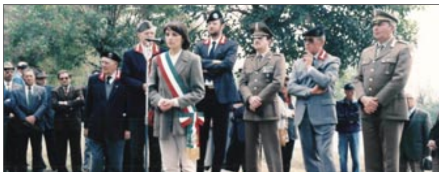
29 ottobre 1995. Flambro. Deposizione della Corona d’alloro. Intervento del Sindaco