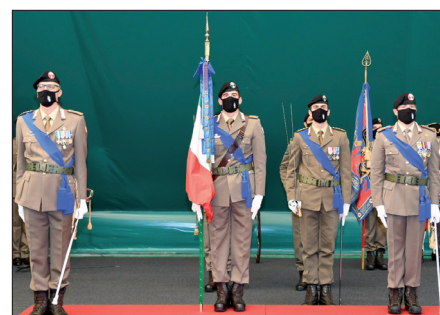
CAMBIO DEL COMANDANTE DEL 1° REGGIMENTO