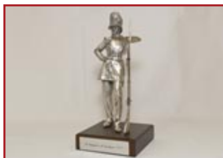
STATUETTA GRANATIERE 1848 GRANDE € 55,00