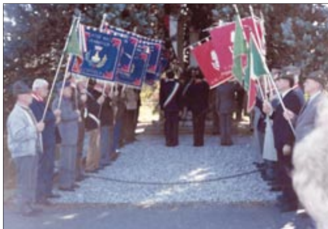
8 ottobre 1990. Flambro. Raduno interregionale in occasione dell'anniversario della battaglia del 30 ottobre 1917

di vertice dell'Associazione nonché ai componenti del Comitato Centrale... È pur vero che una tale scelta, specie per le cariche di punta e per un sodalizio non molto esteso come il nostro, non è mai stata semplice né facile anche se nelle sue file si sono annoverate persone qualificate e capaci per precedenti di carriera o di professione ma è altrettanto vero che la funzione direttiva deve essere assicurata da Granatieri sui cui nominativi converga un largo consenso e la fiducia dei suoi Quadri e che soprattutto, siano disposti ad accollarsi le incombenze derivanti dai relativi incarichi senza corrispettivi se non d'ordine morale.” (Editoriale de IL GRANATIERE, n. 1, gennaio – marzo 1990).