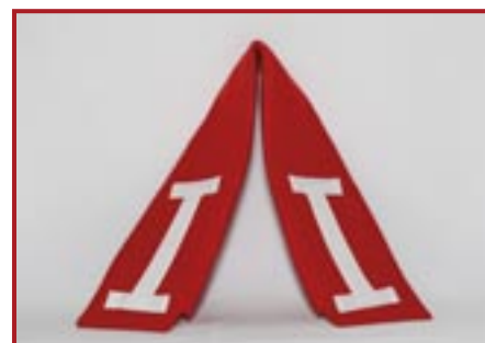
BAVERO DI PANNO ROSSO CON ALAMARI € 10,00