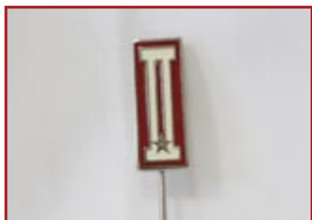
ALAMARO A SPILLO ARGENTATO € 7,00