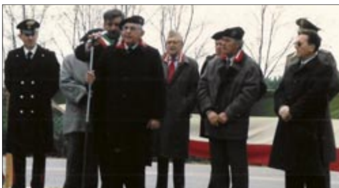
27 ottobre 1991. Flambro. Raduno annuale per commemorare il combattimento del 30 ottobre 1917 e la MOVIM Col. Emidio Spinucci. Intervento del Gen. Perrone Capano della Presidenza nazionale

In quasi tutte le edizioni apparvero disegni di figure di Granatieri visti dal suo "pennello".