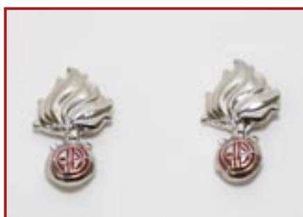
COPPIA DI GRANATINE IN METALLO BIANCO PER BAVERO € 8,00