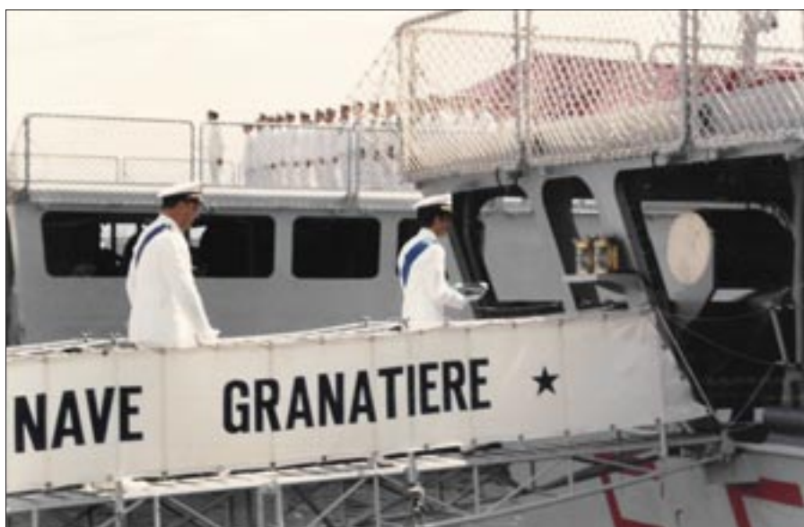
5 luglio 1996. La Spezia. Cerimonia di consegna della Bandiera di combattimento a Nave “Granatiere”

nave, il Cacciatorpediniere Granatiere (II), ricevette la Bandiera di combattimento a Palermo... Per questi motivi abbiamo inteso far scolpire nel legno, sui fianchi del cofano destinato a custodire questa Bandiera, i profili delle navi che sotto lo stesso nome solcarono i mari ed oceani, messaggeri idealmente delle tradizioni di valore e virtù militari dei Marinai d'Italia e dei Granatieri di Sardegna”.