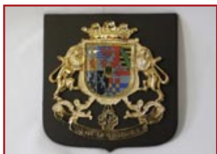
STEMMA ARALDICO IN METALLO PERTASCHINO € 20,00