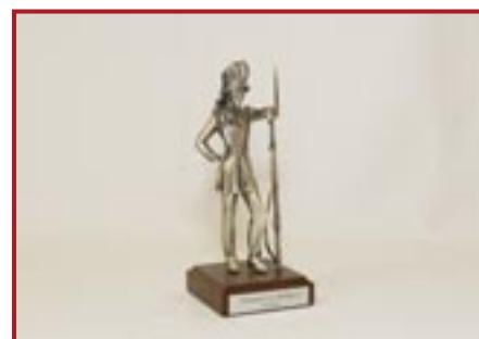
STATUETTA GRANATIERE 1848 MEDIA € 35,00