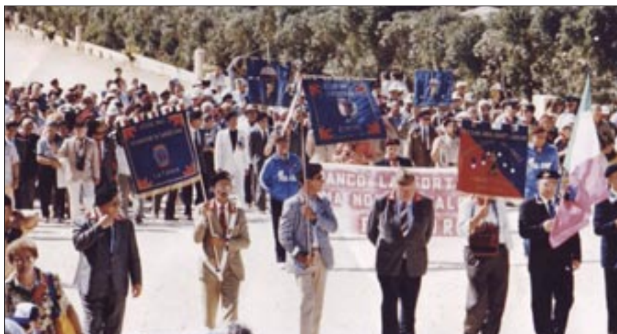
25 ottobre 1992. El Alamein. Cinquantenario della battaglia. Le Bandiere Colonnelle presenti alla Manifestazione

Al di là del pellegrinaggio sul Cengio e la commemorazione di Flambro, il 1993 fu l'anno del cinquantenario della difesa di Roma. Quasi tutta l'attività associativa a livello nazionale si imperniò sull'organizzazione del raduno che si tenne dal 10 al 12 settembre nella