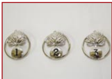
FREGIO METALLICO PER BASCO € 8,00