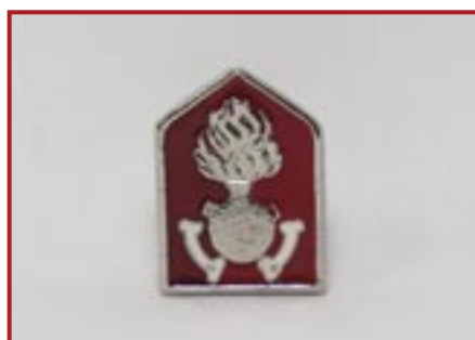
STEMMINO METALLICO CON ALAMARI E GRANATINA € 6,00