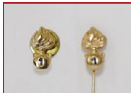
GRANATINE A SPILLO/CLIP IN SIMILORO/SILVER PER GIACCA € 7,00