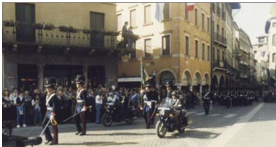
4 - 6 ottobre 1991. Treviso. 24° Raduno nazionale. Dall'alto: momento del saggio di addestramento formale, momento del Carosello storico, sfilamento con in testa la Bandiera di Guerra del 1° reggimento “Granatieri di Sardegna”