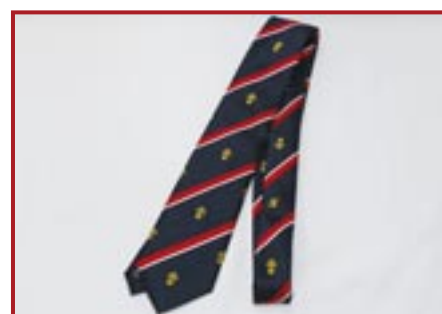
CRAVATTA REGGIMENTALE IN POLIESTERE € 16,00