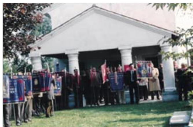
25 ottobre 1992. Flambro. 75° anniversario della battaglia del 30 ottobre 1917. Schieramento delle Bandiere Colonnelle davanti alla chiesetta di San Giovanni