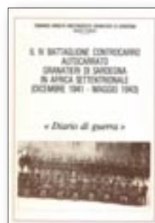
LIBRO "II IV BATTAGLIONE CONTROCARRO AUTOCARRATO GRANATIERI DI SARDEGNA IN AFRICA SETTENTRIONALE" (DICEMBRE 1941-MAGGIO 1943) «Diario di guerra» € 10,00