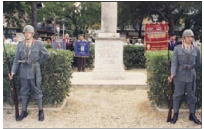
10 - 12 settembre 1993. Roma. 25° Raduno nazionale dell'Associazione Nazionale Granatieri di Sardegna in occasione del 50° anniversario della difesa di Roma. Colonna commemorativa dei combattimenti