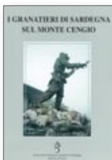
LIBRO "I GRANATIERI DI SARDEGNA SUL MONTE CENGIO" € 8,00