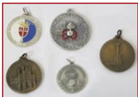
MEDAGLIE DEI VARI RADUNI NAZIONALI € 5,00