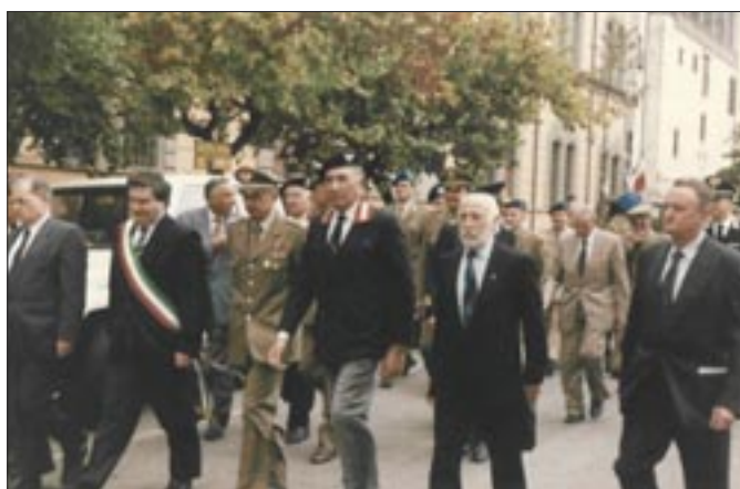
4 ottobre 1992. Viterbo. Cerimonia dello scoprimento della lapide in onore dei Granatieri combattenti in Africa. Le Autorità precedono il corteo