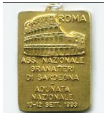
10 - 12 settembre 1993. Roma. 25° Raduno nazionale dell'Associazione Nazionale Granatieri di Sardegna in occasione del 50° anniversario della difesa di Roma. Medaglia commemorativa, fronte (a sinistra) e retro (a destra)