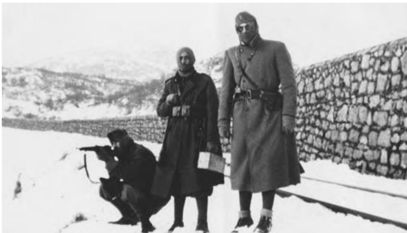
1942: il Tenente Chiti sul fronte del Don

Dedicato a tutti gli uomini e le donne delle Forze Armate e delle Forze dell'ordine.