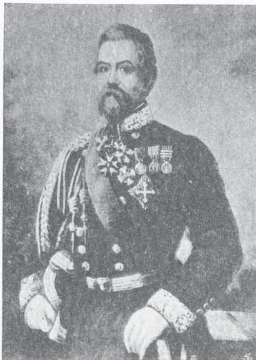
FIG. 84. - Conte CARLO CAMERANA

6. - Conte Carlo CAMERANA. - Nato (3. 2. 1806) - Guardia del Corpo di S. M. (30. 7. 1822) - Sottotenente nelle Guardie del Corpo (31. 7. 1826) - Trasferito nella Brigata Piemonte (1. 3. 1828) - Luogotenente (8. 2. 1831) - Capitano nel 4° di fanteria (1. 7. 1836) - Maggiore nel 20° di fanteria (9. 12. 1848) - Trasferito nel 4° di fanteria (24. 4. 1849) - Tenente colonnello comandante del 10° di fanteria (31. 12. 1852) - Colonnello (12. 6. 1856) - Trasferito al 2° dei Granatieri di Sardegna (3. 5. 1857) - Maggior Generale della Brigata Piemonte (10. 6. 1859) - Trasferito alla Brigata Granatieri di Sardegna (4. 7. 1859) - Comandante dell'8ª Divisione (15. 10. 1860) - Campagne : 1849. 1859. 1860. - Decorazioni : Med. d'arg. al val. mil. (San Martino - 24. 6. 1859) - Comm. nell'Ord. Mil. di Savoia (Perugia - 14. 9. 1860).