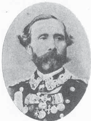
FIG. 87. - VITTORIO FEDERICI

9. - Vittorio FEDERICI. - Nato (16. 4. 1822) - Allievo dell'Accademia militare (12. 2. 1837) - Sottotenente (10. 9. 1842) - Luogotenente di Stato maggiore (12. 9. 1843) - Capitano di Stato maggiore (14. 10. 1848) - Maggiore di Stato maggiore (8. 8. 1857) - Tenente colonnello di Stato maggiore (14. 6. 1860) - Colonnello di Stato maggiore (14. 4. 1861) - Maggior generale (14. 8. 1866) - Comandante della Brigata dei Granatieri di Sardegna (dal 21. 7. 1867 fino al 10. 9. 1871). - Campagne : 1848. 1849. Crimea. 1859. 1866. - Decorazioni : Med. d'arg. al valor mil. (Goito - 30. 5. 1848) - Menz. onor. al valor mil. (Novara - 23. 3. 1849) - Med. d'arg. al valor mil. (Palestro - 30. 5. 1859).