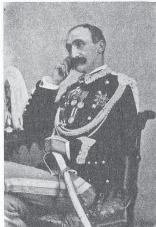
FIG. 89. - Barone GIUSEPPE ACCUSANI DI RETORTO

13. - Barone Giuseppe ACCUSANI DI RETORTO. - Nato (7. 3. 1832) - Allievo della Regia Accademia militare (13. 9. 1847) - Sottotenente (8. 8. 1852) - Tenente nello Stato maggiore d'artiglieria (5. 8. 1853) - Capitano nel reggimento d'artiglieria da piazza (6. 11. 1859) - Trasferito nell'8° d'artiglieria (30. 6. 1860) - Maggiore nel 10° d'artiglieria (14. 1. 1864) - Trasferito nel 4° (21. 1. 1864), nel 7° (15. 3. 1867) d'artiglieria, nello Stato maggiore dell'arma (18. 11. 1869), nel 5° (7. 11. 1870), nel 4° (18. 12. 1870), nel 6° (22. 9. 1872) d'artiglieria - Tenente colonnello (11. 12. 1873) - Trasferito nel 12° d'artiglieria (1. 1. 1874) - Segretario al Comitato d'Artiglieria e Genio (24. 4. 1877) - Direttore di Artiglieria a Genova (9. 6. 1877) - Colonnello (15. 7. 1877) - Comandante del 3° d'artiglieria (24. 6. 1878) - Comandante della Brigata dei Granatieri di Sardegna (30. 5. 1884) - Maggior generale (22. 9. 1884) - Collocato in disponibilità (10. 8. 1888) - Comandante della Regia Accademia militare (14. 4. 1889). - Campagne : 1859. 1860.