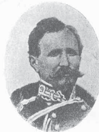
FIG. 83. - LUIGI SCOZIA DI CALLIANO

5. - Luigi SCOZIA DI CALLIANO. - Nato (2. 6. 1802) - Granatiere volontario nelle Guardie (28. 4. 1820) - Caporale (1. 1. 1821) - Sergente (1. 5. 1821) - Sottotenente (14. 11. 1821) - Luogotenente (1. 2. 1826) - Capitano (18. 4. 1830) - Maggiore (30. 4. 1844) - Colonnello in 2° (13. 8. 1848) - Colonnello comandante dei Granatieri delle Guardie (5. 4. 1849) - Trasferito al comando della Brigata Regina (25. 9. 1853) - Maggiore generale (1. 8. 1855) - Trasferito al comando della Brigata Granatieri di Sardegna (dal 12. 3. 1859 al 4. 7. 1859) - Campagne: 1848. 1849. 1859.