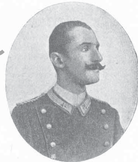
FIG. 77 - Tenente U. BASSI († ad Adua)

Noi intanto siamo orgogliosi di segnare qui il termine delle nostre memorie storiche in modo degno della magnificenza delle cose che vi si contengono per virtù dei nostri maggiori. Infatti l'ultima notizia che dobbiamo scrivere, bene ammonitrice a noi e a quelli che verranno dopo di noi attorno alle bandiere dei Granatieri di Sardegna, è della medaglia d'oro al valor militare che premiò l'eroico e cosciente sacrificio del capitano Rossini alla fede e all'onore di buon soldato.