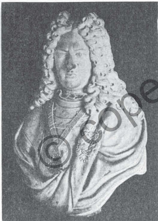
FIG. 93. - CARLO EMILIO SAN MARTINO DI PARELLA

Durante il lungo comando del Parella, essendo questi spesso destinato ad altri uffici di pace e di guerra, come abbiamo avuto occasione di vedere, il comando effettivo del reggimento fu nelle mani del tenente colonnello assai di frequente. A tale ufficio fu assunto nel marzo del 1691 il conte Carlo Giuseppe di Castellamonte che rimase nel reggimento collo stesso grado fino al 20 di marzo del 1711, quando venne « prouisto d'altro impiego » come dicono i Ruoli di quell'anno. Poichè questa data del 20 di marzo del 1711 è la medesima colla quale l'Andorno fu fatto colonnello del reggimento delle Guardie, si può supporre che il Duca Vittorio Amedeo II non abbia voluto lasciare