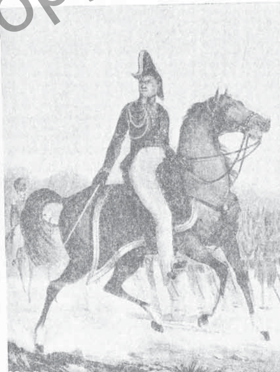
FIG. 79 - Conte BONIFACIO MICHELE NEGRI DI S. FRONT.

I. — Conte Bonifacio Michele NEGRI DI S. FRONT. — Nato (19. 4. 1776) — Sottot. nel regg. prov. d'Acqui (28. 9. 1786) — Luogotenente (15. 6. 1793) — Capitano (5. 12. 1814) — In servizio permanente nel regg. Alessandria (24. 12. 1815) — Maggiore (5. 5. 1817) — Trasferito nella Brigata Saluzzo (29. 1. 1821) — Tenente colonnello nella Brigata della Regina (31. 12. 1821) — Trasferito nella Brigata Acqui (11. 5. 1822) — Trasferito nella Brigata Regina (22. 1. 1823) — Colonnello nella Brigata Regina (16. 1. 1825) — Trasferito nella Brigata Aosta (16. 1. 1828) — Trasferito nella Brigata Guardie (9. 12. 1830) — Maggior generale aiutante di campo di S. M. (16. 8. 1831) — Trasferito al comando della Brigata Guardie (dall'1. 1. 1832 al 17. 11. 1837) — Campagne : 1792. 1793. 1794. 1796. 1800 — Ferite : a (?) il 7. 4. 1800 — Decorazioni : Cav. dell'Ord. Mil. di Savoia (6. 9. 1816).