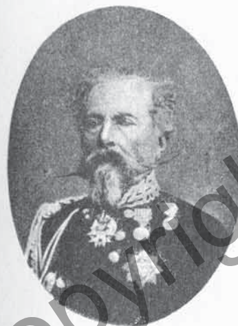
FIG. 82. - Conte MARCELLO GIANOTTI

3. - Conte Giuseppe BISCARETTI DI RUFFIA. — Nato (27. 9. 1796) - Sottotenente dei Granatieri delle Guardie (8. 9. 1815) - Luogotenente (23. 12. 1815) - Capitano (22. 12. 1821) - Maggiore (25. 6. 1831) - Tenente colonnello (16. 8. 1836) - Colonnello in 2° (18. 6. 1839) - Colonnello comandante dei Granatieri delle Guardie (26. 11. 1839) - Maggiore generale comandante della Brigata Guardie (1. 3. 1848) - Tenente generale (31. 12. 1852) - Campagne: 1815. 1848 - Decorazioni: Menz. onor. al val. mil. (S. Lucia - 6. 5. 1848) - Med. d'arg. al val. mil. (Goito - 30. 5. 1848).