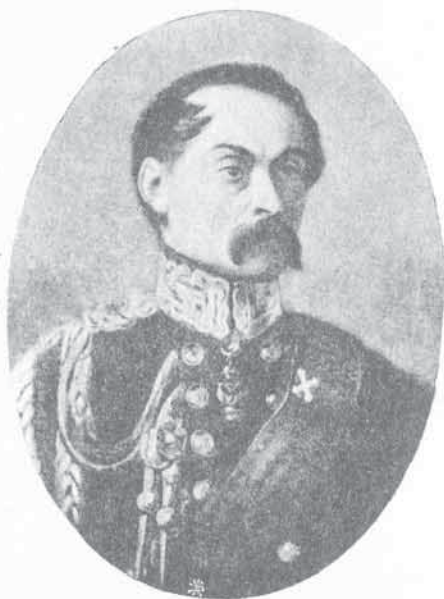
FIG. 80. Marchese FEDERICO MILLET D'ARVILLARS

2. - Marchese Federico MILLET D'ARVILLARS. — Nato (26. 9. 1788) - Luogotenente nei Carabinieri Reali (23. 5. 1815) - Luogotenente provinciale nella Brigata Savoia (7. 1. 1816) - Capitano (17. 2. 1816) - Maresciallo d'alloggio nelle Guardie del Corpo di S. M. (15. 3. 1816) - Cornetta sovrannumerario nelle Guardie del Corpo, col grado di Tenente colonnello di cavalleria (22. 3. 1831) - Colonnello del 2° reggimento della Brigata Savoia (15. 12. 1831) - Maggiore generale della Brigata Savoia (29. 12. 1836) - Trasferito alla Brigata Guardie (6. 12. 1837) - Tenente generale comandante la Divisione di Alessandria (29. 2. 1848).