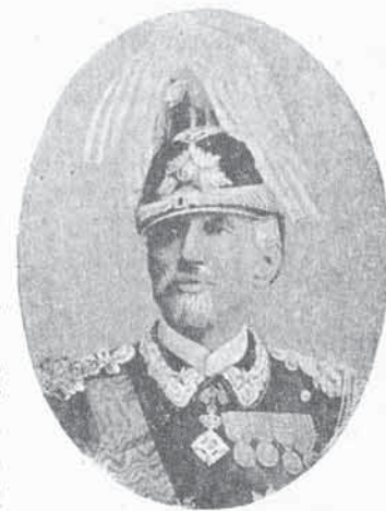
FIG. 86. - Conte CARLO FELICE NICOLIS DI ROBILANT

8. - Conte Carlo Felice NICOLIS DI ROBILANT. - Nato (8. 8. 1826) - Allievo dell'Accademia Militare (9. 3. 1839) - Sottotenente di artiglieria (20. 9. 1845) - Luogotenente (18. 8. 1846) - Capitano (4. 5. 1853) - Maggiore (11. 3. 1860) - Trasferito nel Corpo di Stato Maggiore (13. 3. 1860) - Luogotenente colonnello (21. 11. 1860) - Colonnello (2. 3. 1862) - Comandante del 5° di Granatieri (5. 6. 1865) - Maggior generale (20. 8. 1866) - Comandante della Brigata di Granatieri di Sardegna (13. 10. 1866) - Comandante della Scuola superiore di Guerra (21. 7. 1867) - Campagne : 1848. 1849. 1860-61. 1866 - Ferite : Novara (23. 3. 1849) - Decorazioni : Medaglia d'arg. al valor mil. (Sommacampagna - 24. 7. 1848) - Med. d'arg. al valor mil. (Novara - 23. 3. 1849) - Cav. nell'Ord. Mil. di Savoia (Mola di Gaeta - 4. 11. 1860) - Comm. nell'Ord. Mil. di Savoia (Custoza - 24. 6. 1866).