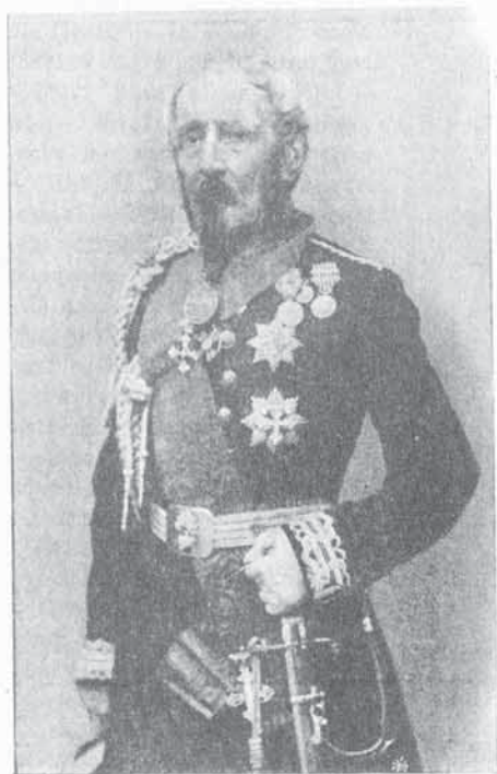
FIG. 81 - Conte GIUSEPPE BISCARETTI DI RUFFIA

3. - Conte Giuseppe BISCARETTI DI RUFFIA. — Nato (27. 9. 1796) - Sottotenente dei Granatieri delle Guardie (8. 9. 1815) - Luogotenente (23. 12. 1815) - Capitano (22. 12. 1821) - Maggiore (25. 6. 1831) - Tenente colonnello (16. 8. 1836) - Colonnello in 2° (18. 6. 1839) - Colonnello comandante dei Granatieri delle Guardie (26. 11. 1839) - Maggiore generale comandante della Brigata Guardie (1. 3. 1848) - Tenente generale (31. 12. 1852) - Campagne: 1815. 1848 - Decorazioni: Menz. onor. al val. mil. (S. Lucia - 6. 5. 1848) - Med. d'arg. al val. mil. (Goito - 30. 5. 1848).