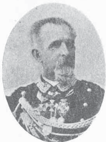
FIG. 90. - FRANCESCO CAREZZI

14. - Francesco CARENZI. - Nato (12. 8. 1837) - Allievo della Regia Accademia Militare (11. 4. 1859) - Sottotenente nel 7° di fanteria (27. 7. 1859) - Trasferito nel 19° di fanteria (1. 11. 1859) - Tenente (15. 9. 1860) - Trasferito nel Corpo di Stato maggiore (5. 5. 1861) - Capitano (12. 3. 1863) - Maggiore nel 67° di fanteria (9. 11. 1872) - Trasferito nel Corpo di Stato maggiore (11. 12. 1873) - Tenente colonnello (15. 7. 1877) - Colonnello del 49° di fanteria (2. 1. 1881) - Trasferito nel Corpo di Stato maggiore (10. 4. 1884) - Comandante della Brigata Forlì (2. 10. 1887) - Comandante della Brigata dei Granatieri di Sardegna (10. 8. 1888) - Maggiore generale (24. 9. 1888) - Comandante della Scuola militare (2. 11. 1890). - Campagne : 1859. 1866.