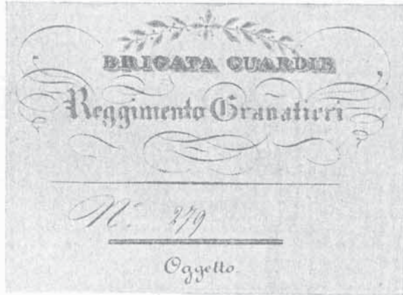
FIG. 78 - LEGGENDA DELLA CARTA DA LETTERE per la corrispondenza ufficiale del reggimento Granatieri della Brigata Guardie (1834).