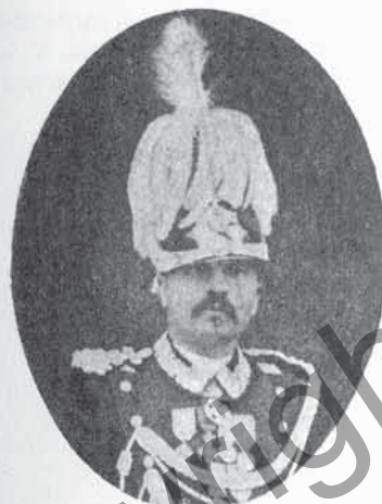
FIG. 88. - FRANCESCO CHIRON

11. Annibale BONI ( Il ritratto è a pag. 696 ). - Nato (6. 5. 1824) - Sottotenente di fanteria al servizio austriaco (29. 9. 1843) - Dimissionario (19. 3. 1848) - Luogotenente di fanteria al servizio del governo provvisorio di Lombardia (1. 6. 1848) - Capitano (25. 6. 1848) - Trasferito al 21° di fanteria (16. 9. 1848) - Trasferito al deposito di ufficiali lombardi di Acqui (1. 6. 1849) - Trasferito al 1° di granatieri della Brigata Guardie (16. 3. 1851) e confermato luogotenente con anzianità dal 1. 6. 1848 (6. 5. 1851) - Trasferito al 7° di fanteria (17. 12. 1851) - Capitano nell'8° di fanteria (30. 3. 1852) - Maggiore nel 10° di fanteria (21. 12. 1859) - Tenente colonnello (31. 12. 1861) - Comandante del 1° di granatieri (10. 6. 1866) - Colonnello (20. 8. 1866) - Colonnello comandante della 1ª Brigata di Fanteria (Granatieri di Sardegna) (26. 4. 1874) - Trasferito al comando della 21ª Brigata di Fanteria (2. 7. 1877). Campagne : 1848. 1849. 1859. 1860-61. 1866. - Decorazioni : Med. d'arg. al valor mil. (Mortara, 21. 6. 1849) - Cav. nell'Ord. Mil. di Savoia (Castelfidardo - 18. 9. 1860) - Cav. nell'Ord. del Ss. Maurizio e Lazzaro (Assedio di Gaeta - 1860) - Med. d'oro al valor. mil. (Custoza - 24. 6. 1866).